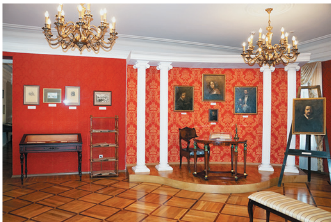
Зал «Обыкновенная история» экспозиции Историко-мемориального центра-музея И.А. Гончарова в г. Ульяновск

музей). Среди Л.п.м. имеются гос., ведомств., школьные, церк. музеи ( Библии музей ).