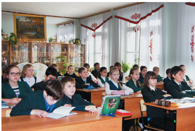
На занятии по историко-литературному краеведению и музееведению в Музее литературы Мордовии в г. Саранск

В год в музее бывают до 2500 посетителей, экскурсии для них проводят учащиеся. На базе музея работают поэтич. клуб «Эрямонь лисьмапря» («Животворный родник», с 1991, первый науч. рук. И.К. Инжеватов) и об-во «Мордовия литературная» (с 1989). Занятия, семинары, конф. проходят по программе «Историколит. краеведение и музееведение» (автор Гордеева). Ведется «Летопись музея».