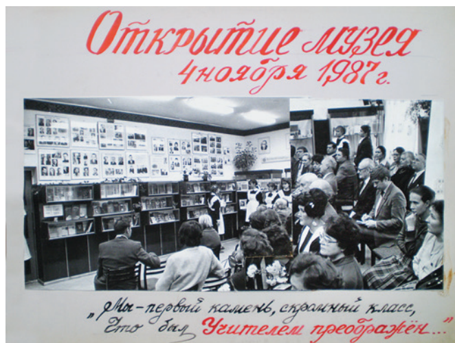
Открытие Музея литературы Мордовии в г. Саранск 4 ноября 1987 г.